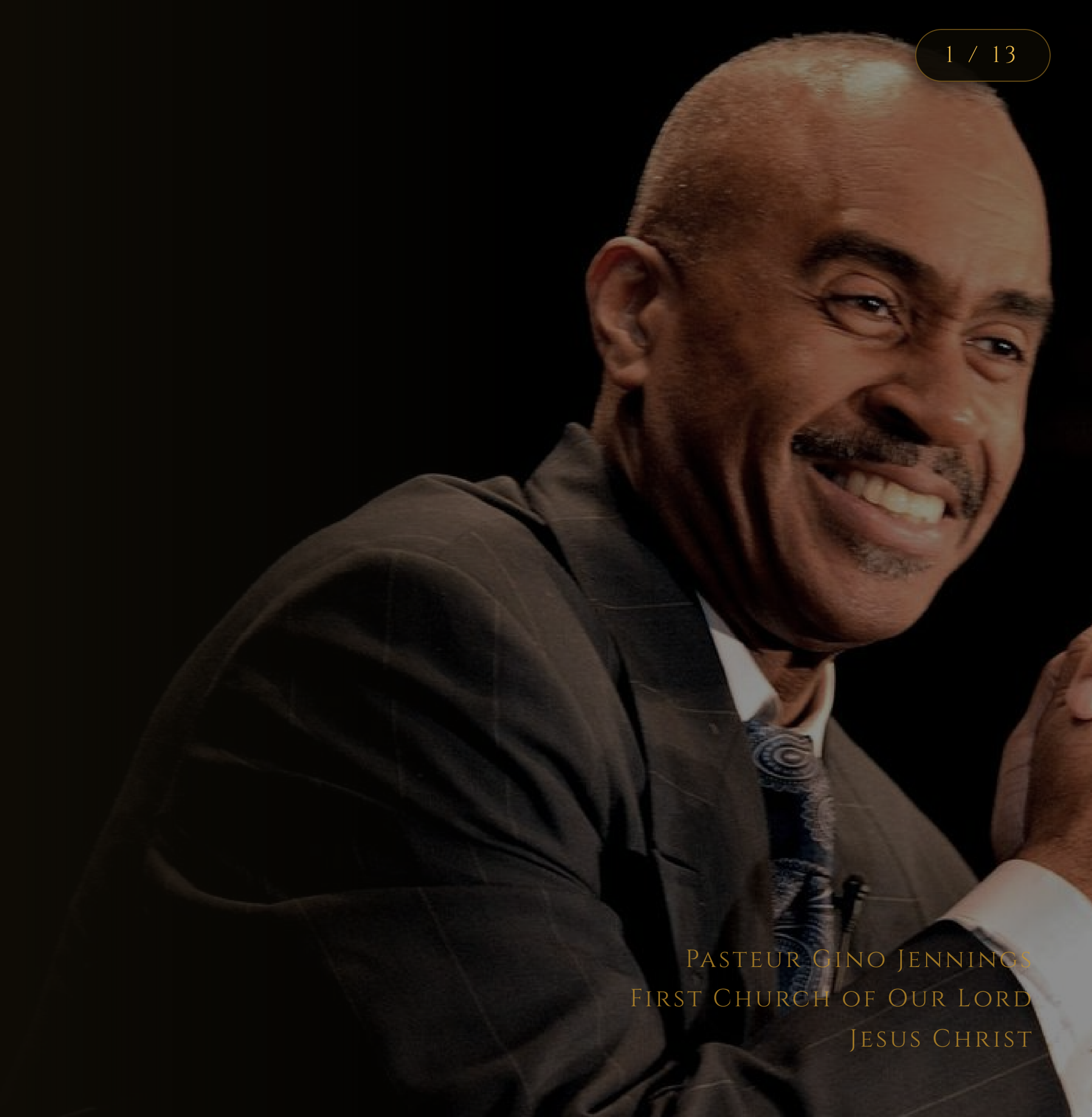
PASTEUR GINO JENNINGS FIRST CHURCH OF OUR LORD JESUS CHRIST